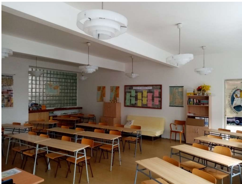
Obrázok 1 Odborná učebňa IT4