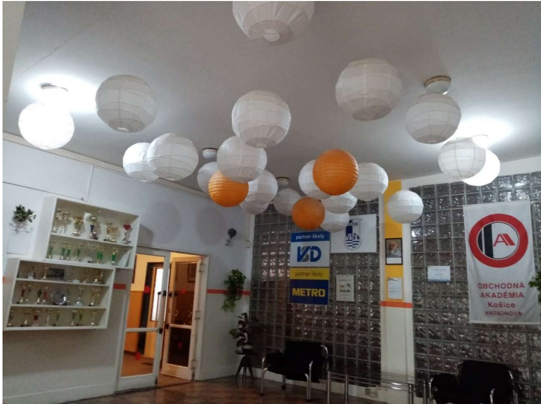
Obrázok 3 Administratívna budova - vstup