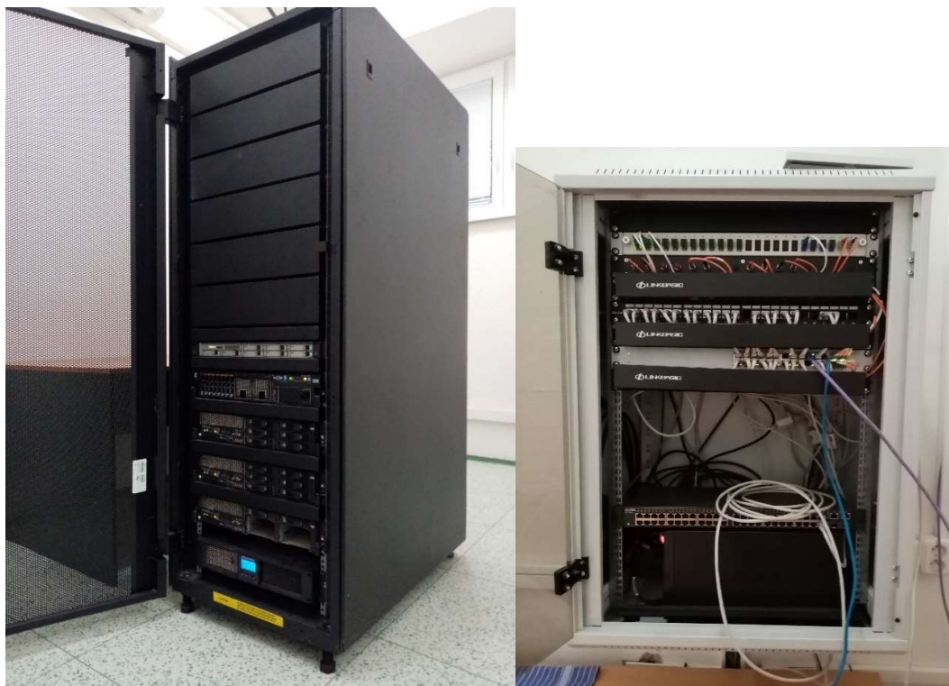
Obrázok 2 Nová serverovňa so sieťovými komponentmi